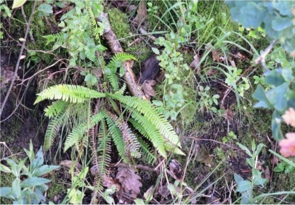
Dubbelloof en sterzegge