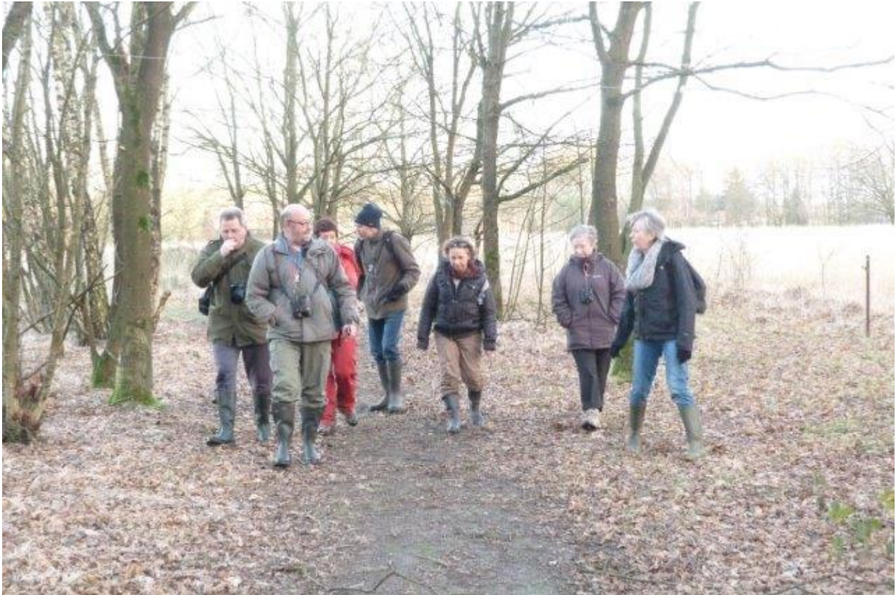
Een meer dan behoorlijke opkomst voor de startwandeling van 2014