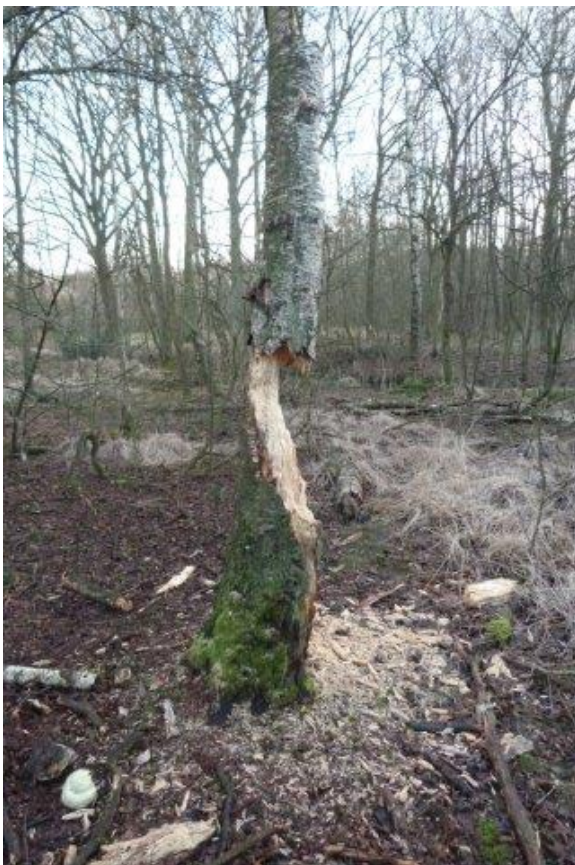
Hier had de specht stevig werk geleverd