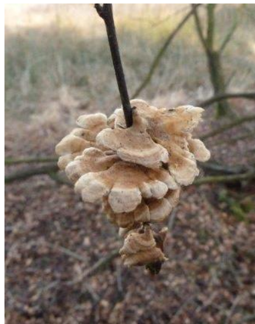
Dit ploivlieswaaiertje had niet veel tak nodig om zich aan te hangen