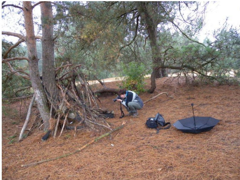
de fotograaf van dienst