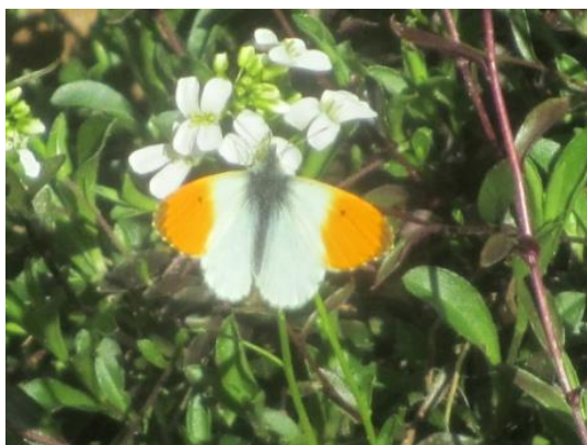
Figuur 1: Oranjetipje (AB)

Bij een lekkere gageleer hebben we nog eens nagekaart: jammer van het slechte weer, maar het was toch weer de moeite. Tot onze volgende wandeling op zondag 28/05/2017.