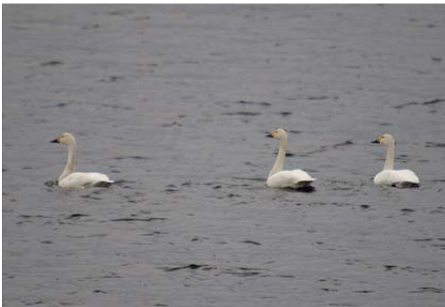
Adulte Kleine Zwanen, Put Rauw Noord, 6 november