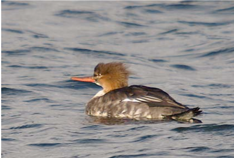
Wijfje Middelste Zaagbek, Put Rauw, 6 november (Lex Peeters)

In het najaar werd deze kustsoort maar liefst driemaal waargenomen: