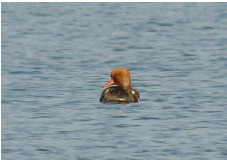
Man Krooneend, Glasfabriek, 18 november (Lex Peeters)

Een man Krooneend die de winter doorbracht op de grote vijver van Prinsenspark bleef daar tot ver in april, wat het laatste geloof in een wilde herkomst deed wegebben (een wilde overwinteraar zou waarschijnlijk in maart vertrokken zijn). Het mannetje dat op 18-11 in een groep Wilde Eenden bij Glasfabriek verbleef wekte wat dat betreft meer vertrouwen. De vogel was schuw en de dag erop alweer verdwenen.