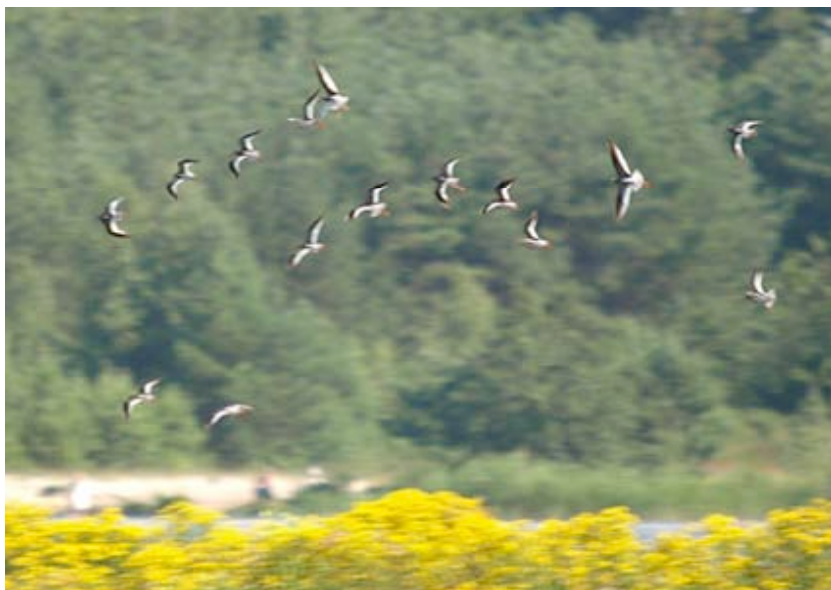
Groep van 15 Tureluurs, Put Rauw, 18 juli

De eerste Tureluur van 2007 werd op 03-03 aangetroffen nabij De Ronde Put. De meeste voorjaarswaarnemingen, over het algemeen kleine aantallen, dateren echter van april en mei, waarbij de soort als pleisteraar voornamelijk werd aangetroffen aan de Grote Kievit, de Grote Zandput en het Kristallijn. Een mooie groep van 15 Tureluurs streek op 18-07 neer in het reservaatgedeelte van Put Rauw. In de eerste helft van augustus werden nog slechts twee waarnemingen verricht en de laatste 2 ex. verbleven op 11-09 aan de Grote Zandput. Dit beeld komt overeen met elders in het binnenland.