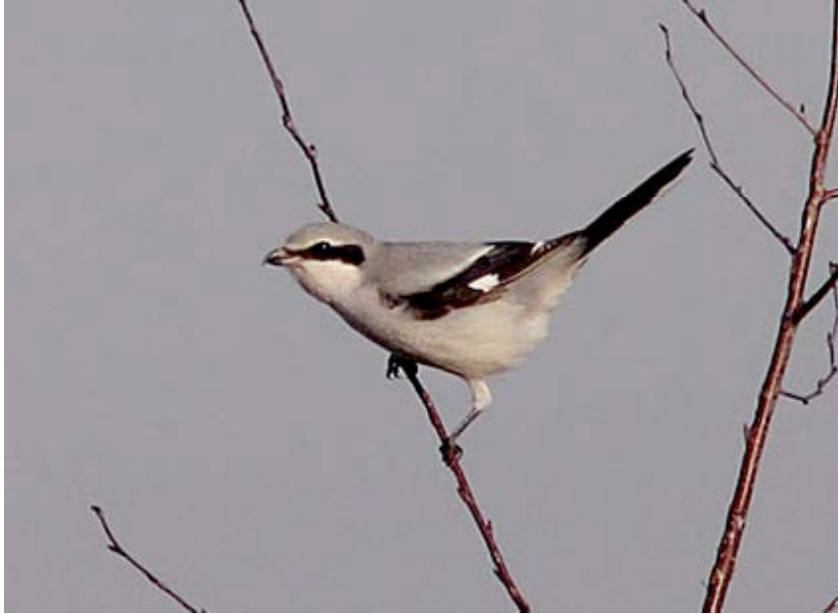
Klapekster, Grote Zandput, 17 november