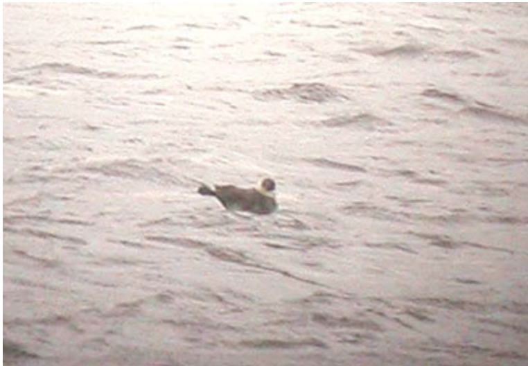
Adulte zomer Middelste Jager, Maatheide, 11 mei (Lex Peeters)

In de stormachtige wind van 11-05 zag Lex Peeters aan de grote baggerput van Maatheide een adulte zomerkleed Middelste Jager voor zich opduiken. De prachtige vogel, compleet met 'schoenlepels' in de staart, nam zelfs korte tijd plaats op het water, op nog geen 50 meter afstand. Na een oriënterende vlucht over de plas verdween hij wat later in westelijke richting.