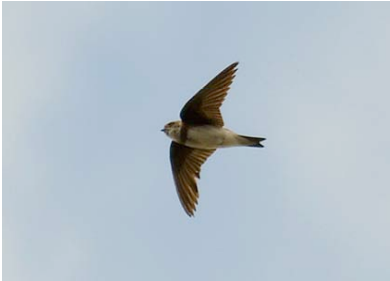
Oeverzwaluw, telpost Kristallijn, 2 september

De eerste Oeverzwaluw van 2007 werd op 25-03 gezien boven Kristallijn. In mei verzamelden veel exemplaren zich boven Put Rauw, om daar te profiteren van het grote insectenaanbod boven het wateroppervlak. Op 11-05 werd er het maximum van circa 500 ex. geteld, in gezelschap van circa 300 Boerenzwaluwen en 50 Huiszwaluwen. Over de telpost werden in totaal 686 trekkers genoteerd. De beste dag voor de soort werd 12-08 met 171 ex. De laatste Oeverzwaluw trok op 21-09 over Maatheide. Op 16-06 werd door Lex Peeters een aantal Oeverzwaluwkolonies bezocht. Dat leidde tot de volgende resultaten: De Pinken Witgoor 48 bezette holen (deel ging later verloren door afkalving van de oever); Grote Zandput 48 bezette holen; Maatheide grote baggerput 138 bezette holen; Maatheide nieuwe groeve 61 bezette holen. Al eerder werd aan de noordzijde van Kristallijn een kolonie van 20 holen vastgesteld, maar het is maar de vraag of die de drukke graafwerkzaamheden in juni/juli succesvol zal hebben doorstaan. Feit is dat op 02-09 bleek dat daar nog erg laat in het seizoen 30 en 12 holen waren gegraven in een dijk die pas in juni werd voltooid. Diverse holen werden op dat moment nog door oudervogels met voedsel bezocht. Wellicht betrof het dus een hervestiging van verstoorde vogels. Eric Peetermans tenslotte, telde op 17-06 41 nestholen aan de Dekshoevevijver. De totale broedpopulatie in de regio omvatte in 2007 dus minimaal 378 paartjes.