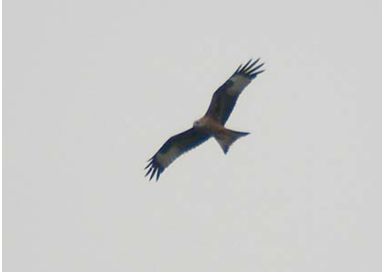
Rode Wouw, 2 september, Goordomein Retie (Lex Peeters)

Alle waarnemingen van 2007 op een rijtje: