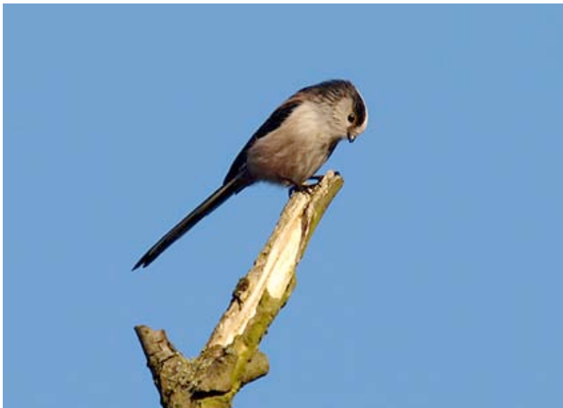
Staartmees, Scheps, 18 november (Lex Peeters)

Geen bijzonderheden ten aanzien van deze algemene jaarvogel.