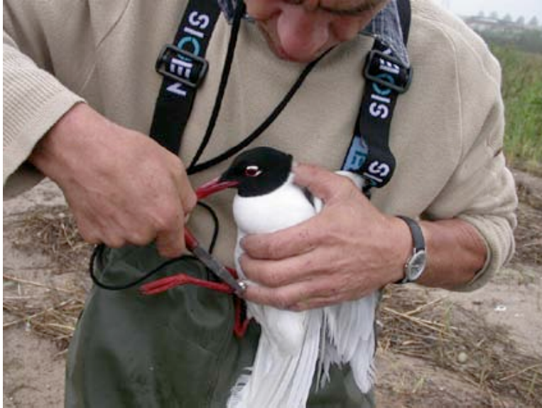
Adulte Zwartkopmeeuw wordt bij Glasfabriek geringd (Karel van Endert)

Ringwerk van Werkgroep 4 Noord-Limburg en Zwartkopmeeuwonderzoeker Renaud Flamant verschafte ons uiteindelijk inzicht in het aantal broedparen. Zij troffen 15 nesten aan, waarvan er uiteindelijk één door zware regenval zou worden weggespoeld. 26 pulli en 11 adulten werden van kleurringen voorzien.