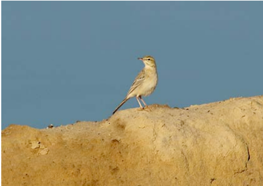
Duinpieper, Maatheide, 24 augustus (Lex Peeters)

Voor het waarnemen van Duinpiepers is – niet zo verwonderlijk – megazandbak Maatheide the place to be . Er werden niet minder dan 17 ex. op trek waargenomen, waarvan de hoofdmoot in de derde decade van augustus: