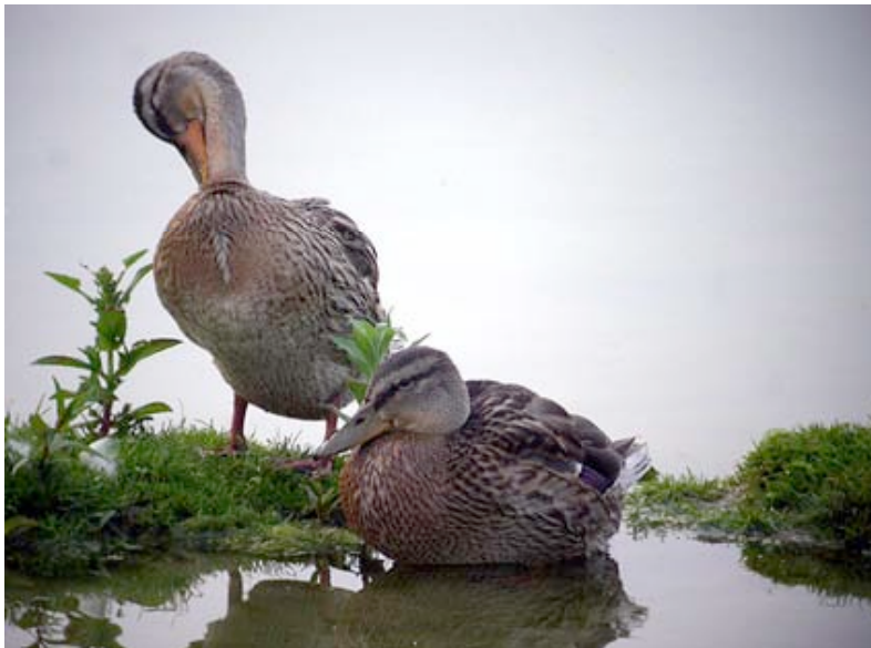
Wilde Eenden, Kristallijn, 12 juni (Lex Peeters)

Ongetwijfeld aangezet door het zachte weer broedde een wijfje Wilde Eend al op 10-02 op 14 eieren aan de Wateringen.