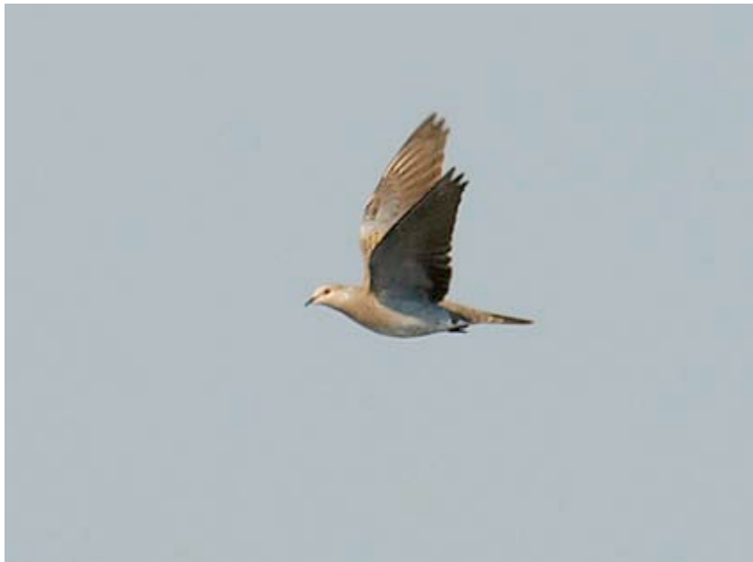
Zomertortel, trektelpost Maatheide, 12 augustus (Lex Peeters)

De eerste Zomertortel van het jaar werd op 02-05 gezien, overtrekkend over Maatheide. De vogel leidde een desastreus broedseizoen in, waarin zelfs tal van traditionele broedplaatsen en biotopen onbezet zouden blijven. Snorrende Zomertortels werden o.a. nog gehoord langs het kanaal van Beverlo op de kruising met het loopje van Stevensvennen (1) en 't Goorke te Arendonk (2). Het loont de moeite om in 2008 elke zangpost te melden, zodat we een beter beeld krijgen van de actuele stand van zaken in de regio.