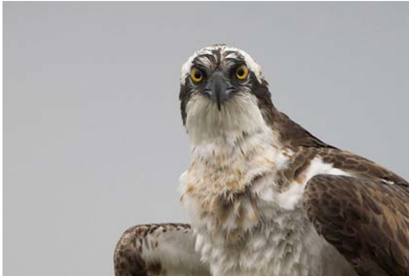
Visarend, Grote Zandput, 17 september (Marc van Meeuwen)

De eerste Visarend van 2007 werd op 08-04 waargenomen boven Geel-Stelen. Daarna verschenen weer regelmatig jagende en overtrekkende ex. in de regio. De Grote Zandput bleek traditioneel favoriet, maar ook het viskweekvijvercomplex Bankei bij Wezel, de omgeving van het Maatreservaat en Ronde Put/Wateringen waren als fourageergebied in trek. Over telpost Kristallijn/Maatheide passeerden 6 trekkers in april en 2 in mei. Het laatste ex. verbleef op 10 en 15-05 bij de Grote Zandput.