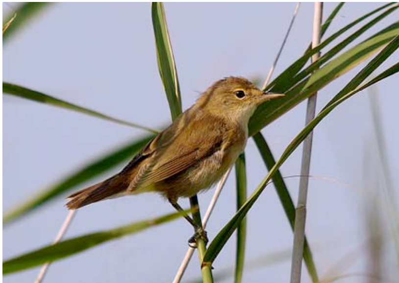
Kleine Karekiet, Grote Zandput, 3 augustus (Lex Peeters)

De eerste Kleine Karekiet van 2007 klonk pas op 26-04 aan de plassen bij Glasfabriek. Daarop volgde blijkbaar een nacht waarin de soort massaal arriveerde, want de ochtend erop was deze weer in alle rietkragen in de regio present.