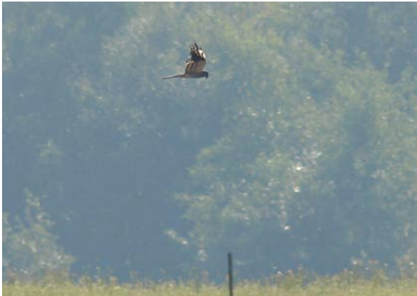
Man Grauwe Kiekendief, Maatheide, 24 augustus (Lex Peeters)

Drie waarnemingen, allen vanaf de telpost: