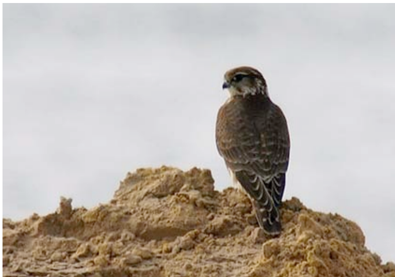
Smelleken, Maatheide, 23 september (Lex Peeters)

In het voorjaar werden over Maatheide 10 trekkende Smellekens waargenomen, waarvan het laatste op 02-05. Op 24-08 passeerde daar weer het eerste ex. van het najaar. Er zouden er nog 57 volgen, met 10 ex. (+ 2 ter plaatse) op 28-09 als absolute climax. Maatheide is door het open terrein en de grote aantallen Graspiepers en Veldleeuweriken bijzonder aantrekkelijk voor Smellekens. Buiten de overtrekkende vogels was er tot ver in oktober dan ook nagenoeg doorlopend een pleisterend ex. aanwezig.