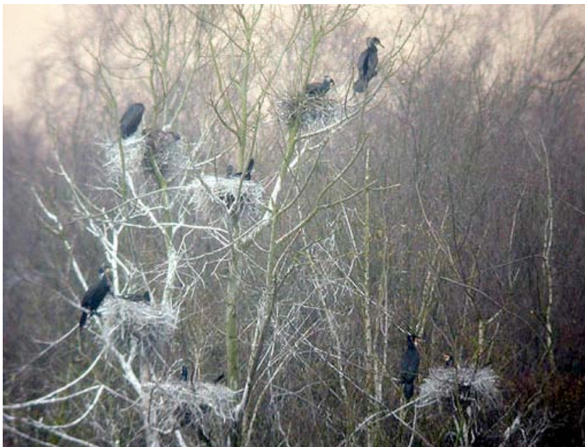
Aalscholverkolonie Stroobants, 30 maart (Lex Peeters)

Op 20-02 werden in de Aalscholverkolonie van Stroobants reeds de eerste broedende exemplaren aangetroffen. Op 24-02 waren minimaal 15 nesten bezet, op 02-03 17, op 16-03 27 en op 30-03 39. Uiteindelijk zou de kolonie 48 nesten tellen, met eind april al grote bedelende jongen. Behalve als broedplaats bleef de plas in maart ook dienst doen als slaapplek (zie hieronder).