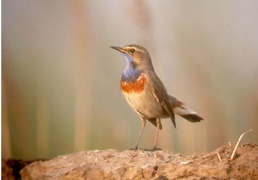
Blauwborst, Maatheide zuidoost, 13 april (Lex Peeters)

Territoria van Blauwborsten werden maar op drie locaties aandachtig geteld. In de rietvegetatie rond de Grote Zandput werden 5 tot 7 zangposten vastgesteld, in de oosthoek van Maatheide 3 en in de omgeving van Glasfabriek 5. In het Maatreservaat waren minimaal 2 territoria gevestigd.