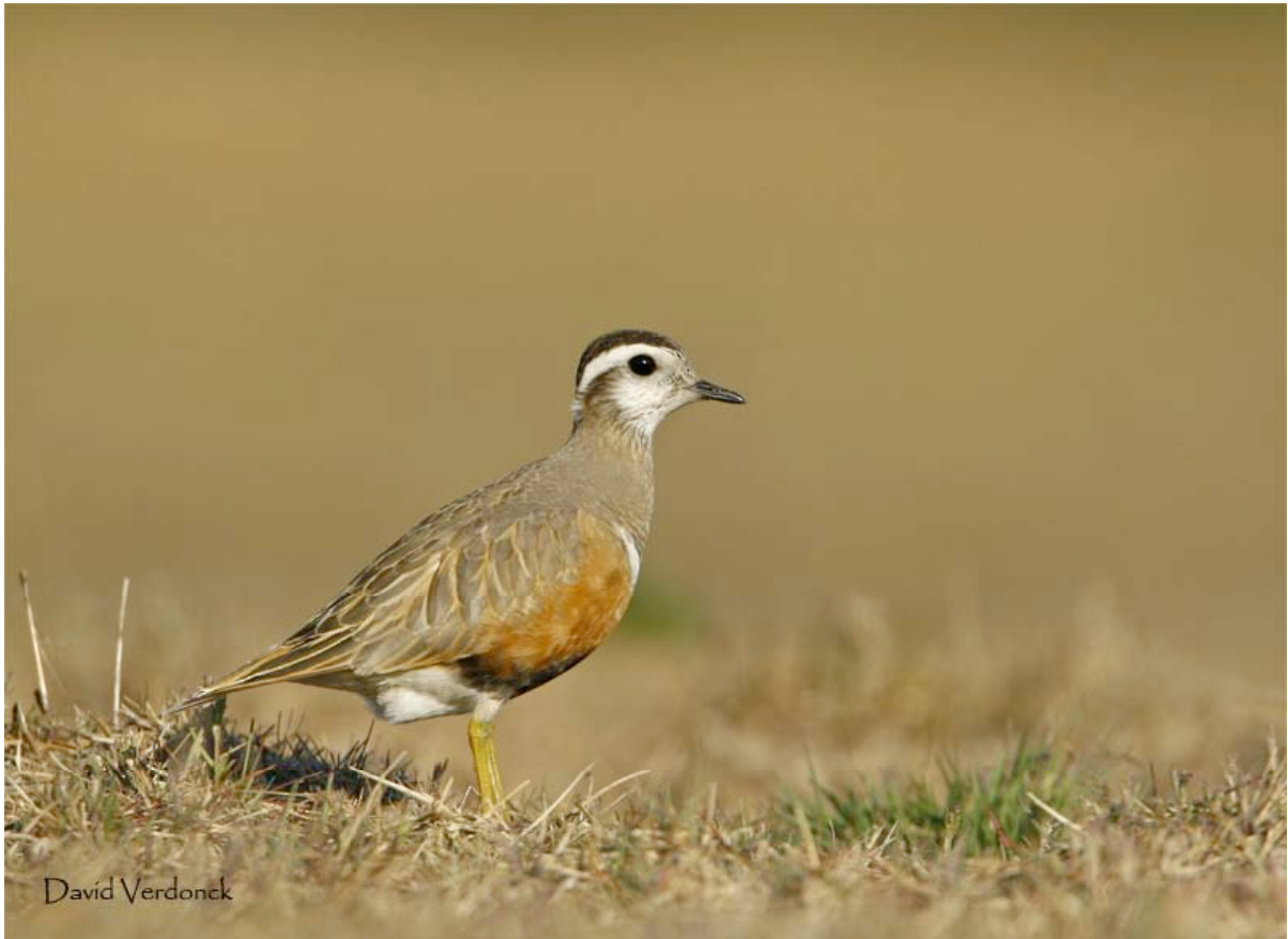
Morinelplevier, Maatheide, 1 mei (David Verdonck)