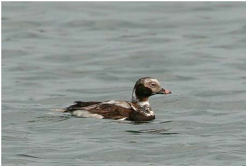
IJseend, mannetje overgangskleed, Blauwe Kei, 4 mei