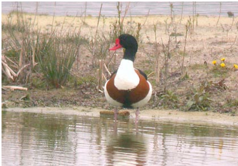
Adulte man Bergeend, Kristallijn, 30 maart

De eerste Bergeenden arriveerden dit jaar op 03-02 aan de grote plas van Rauw (1 ex.) en Kristallijn (3 ex.). Op 24-02 waren 7 ex. aanwezig op de Grote Zandput, 1 ex. op put Rauw, 3 ex. aan Kristallijn en 1 ex. op Dekshoevevijver. Op de Grote Zandput bevonden zich op 23-04 13 en op 12-05 onverwachts 11 adulte ex.