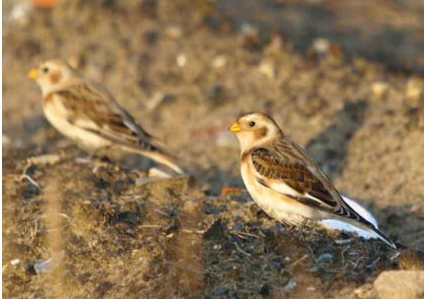
Sneeuwgorzen, Maatheide, 18 november