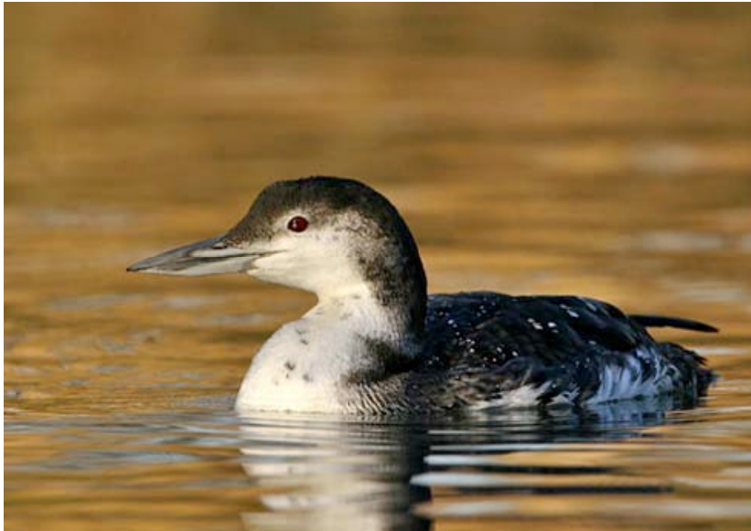
Adulte IJsduiker, Geel Olen, januari (David Verdonck)

Een makke adulte IJsduiker, die op 10 december 2006 was ontdekt op het kanaal bij Olen (Geel), verplaatste zich al kort daarna naar het Kempisch Kanaal bij het gehucht Ten Aard. Daar raakte hij op 07-01 verstrikt in een vislijn. Hij moest worden overgebracht naar het Vogelopvangcentrum van Opglabbeek en zou uiteindelijk op 07-02 in VOC Oostende (betere verzorgingsfaciliteiten) overlijden.