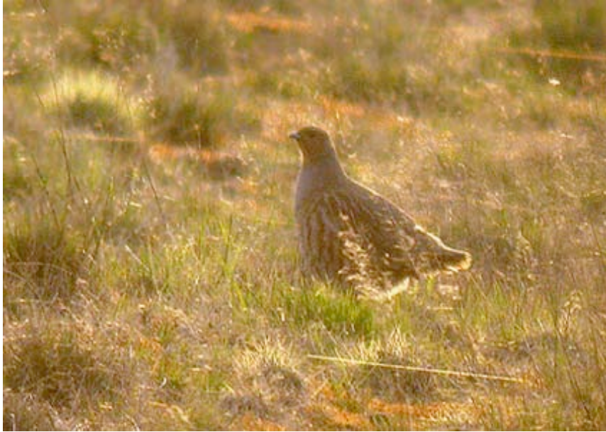
Patrijs, Maatheide, 18 april (Lex Peeters)

Op Maatheide, waar drie koppeltjes baltsten en succesvol werd gebroed, formeerde zich in het najaar een mooie groep van 14 ex., maar in november was die door jacht alweer uitgedund tot 8. Tegenstrijdig dat jagers een kwetsbare populatie van zo'n populaire jachtsoort niet de kans gunnen zich te versterken.