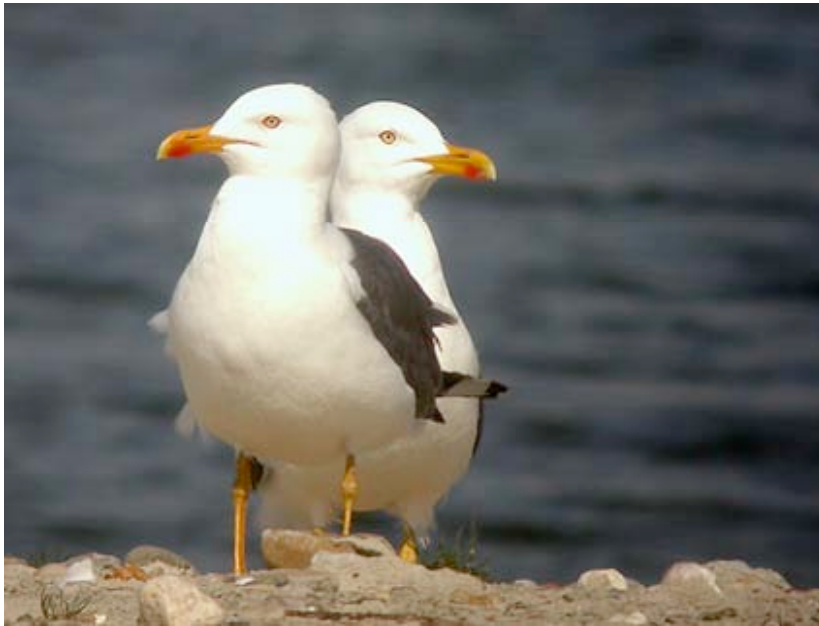
Kleine Mantelmeeuwen, Wezel, 1 april (Lex Peeters)

370 Kleine Mantelmeeuwen werden trekkend over Kristallijn/Maatheide waargenomen, waarvan 213 in april/mei. Dat correspondeert mooi met de periode waarin de vogels van de overwinteringsplaatsen naar de broedkolonies trekken. Van grote aantallen was echter nooit sprake: 23 ex. op 23-05 was het maximum.