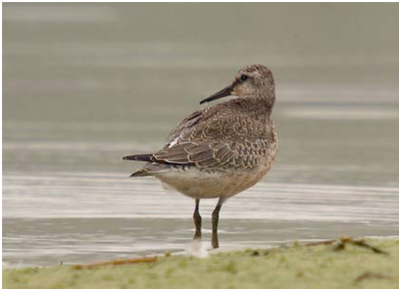
Kanoet, Kristallijn, 3 oktober (Lex Peeters)

Tien waarnemingen, waarvan de meeste (en voor de regio unieke aantallen) tijdens de sterke strandlopertrek, die zich van 07 t/m 13-05 voltrok. Bijzonder is ook het pleisterende ex. begin oktober aan Kristallijn. In het binnenland zijn (late) najaarswaarnemingen zeer schaars.