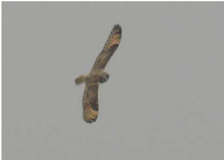
Velduil, Maatheide, 2 oktober