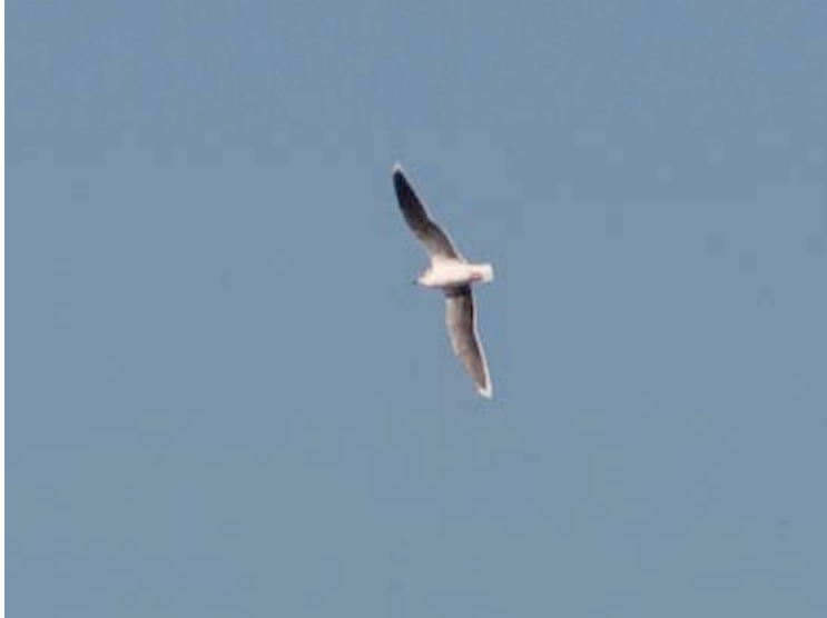
Adulte winter Dwergmeeuw, Maatheide, 15 oktober (Mark van Mierlo)