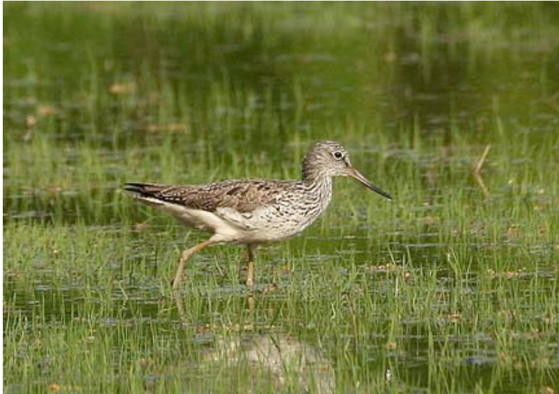
Groenpootruiter, april, Grote Kievit

In de regio wordt de algemene Groenpootruiter door het ontbreken van slikrijke biotopen relatief weinig gezien. In de trekperiode waren regelmatig ex. aanwezig bij de Grote Kievit, in het Buitengoor, aan Kristallijn en in het natuurontwikkelingsgebied bij de Ronde Put. Verder waren de Grote Zandput en Maatheide redelijk in trek, hoewel hun aanwezigheid daar (bij gebrek aan voedsel?) steeds van korte duur was. Uitgerekend die twee locaties leverden wel de grootste groepen op: