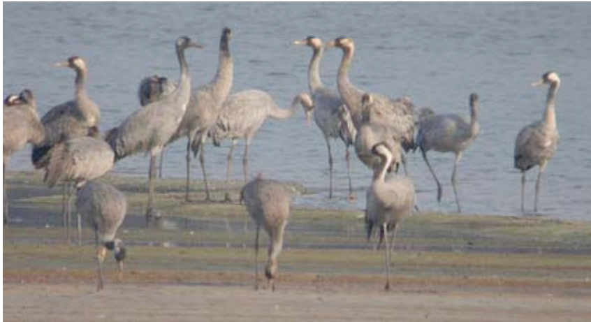
Kraanvogels, Grote Zandput, 2 april (Eddy Vaes)

2007 werd met tien waarnemingen een 'kranig jaar':