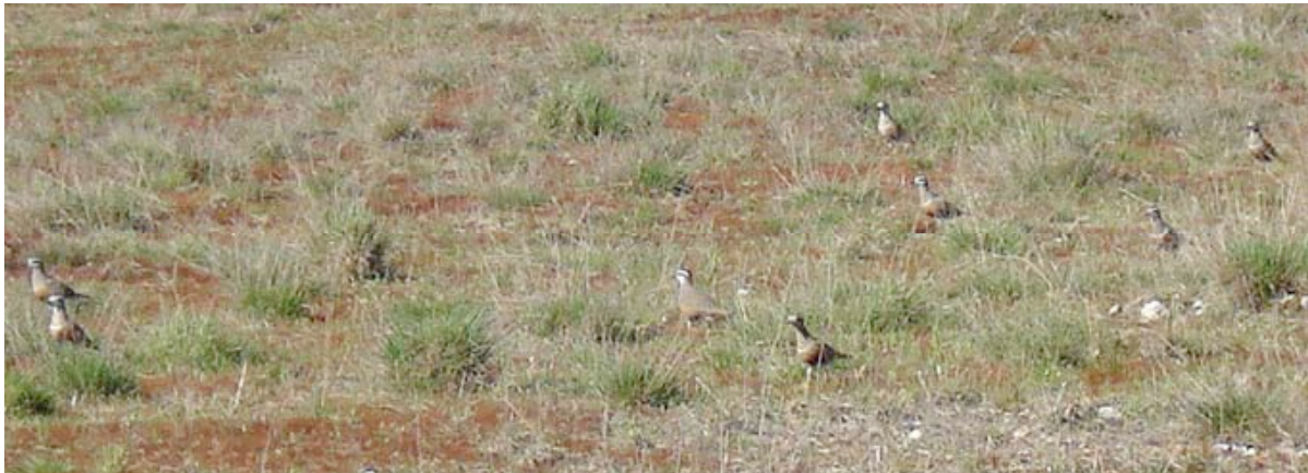
Morinelplevieren, Maatheide, 2 mei (Toon Jansen)

Op 01-05 passeerde een luidroepende Morinelplevier de trektellers op Maatheide. De vogel viel in het oostelijke deel van het terrein in en bleek wat later in gezelschap te zijn van twee soortgenoten. Dit versterkt het vermoeden van Lex Peeters en Nico Venema dat zij al vier dagen eerder, op 28 april, in die hoek 2 ex. zagen opvliegen en opnieuw invallen. De grote afstand en korte waarneemtijd speelden hen toen echter parten.