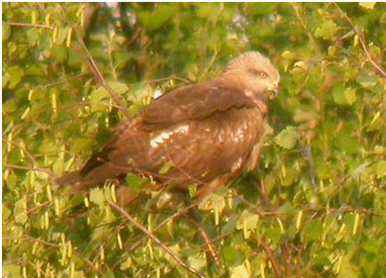
Zwarte Wouw, Maatheide, 4 mei (Lex Peeters)

Het voorjaar van 2007 was goed voor maar liefst 10 waarnemingen: