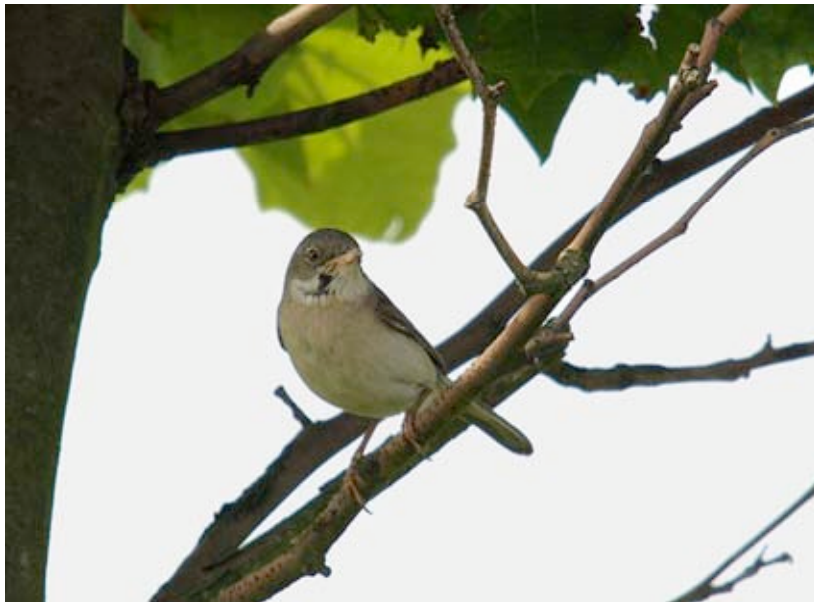
Grasmus, Glasfabriek, 2 juni

Dat de Grasmus het in de regio plaatselijk goed doet, bleek wel uit een inspectie van de braambanen langs de westzijde van Put Rauw Noord. Daar zongen op 04-05 tussen de 20 en 30 ex. De goede biotopen aan de noord- en oostflank van de betreffende plas bleven daarbij nog buiten beschouwing.