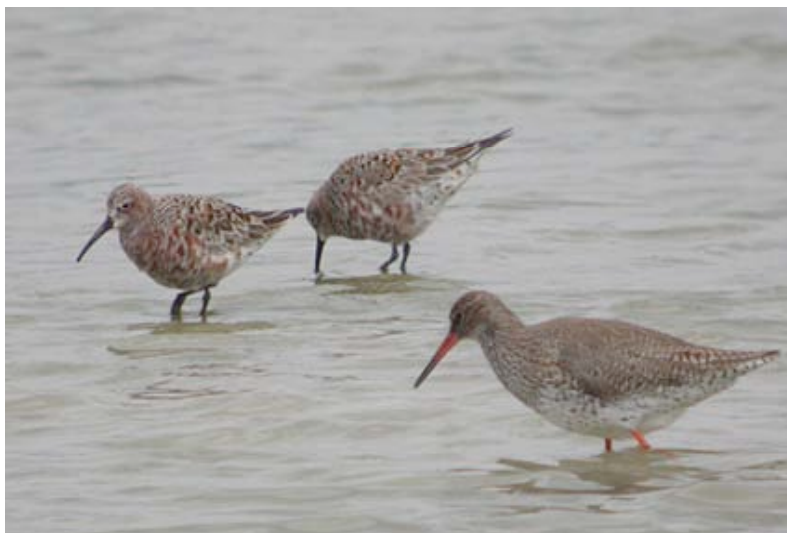
Krombekstrandlopers + Tureluur, Kristallijn, 11 mei (Werner Langhmans)

In 2007 elf waarnemingen die betrekking hebben op tenminste 19 verschillende ex.: