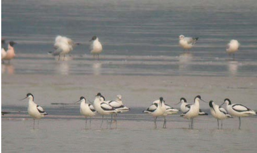
Kluten, Grote Zandput, 16 april