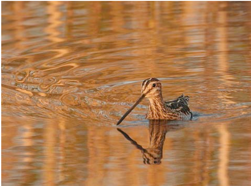
Watersnip, Kattestaart, maart (Jelle van de Veire)

Watersnippen zijn in de regio, zowel tijdens de doortrek als in de winter, wijdverspreid aanwezig. De hoogste dichtheden werden vastgesteld bij Dekshoevevijver, waar de aantallen in het voorjaar, direct na het maaien van het riet op de dijkjes, snel opliep: tot meer dan 50 ex. op 10-03. Andere goede Watersnipplekken bleken De Most (o.a. 23 ex. op 05-09) en de Grote Kievit (o.a. 35 ex. op 16-12). In totaal werden over telpost Kristallijn/Maatheide slechts 16 trekkende ex. opgemerkt. In het natuurontwikkelingsdeel van Scheps was in 2007 een territoriaal paartje present.