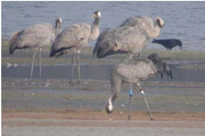
Gekleurringde 'Duitse' Kraanvogel, Grote Zandput (Eddy Vaes)