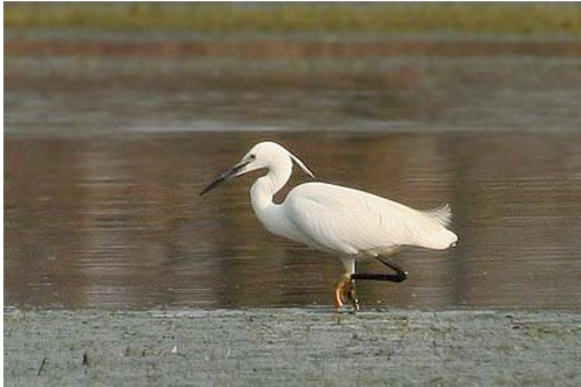
Kleine Zilverreiger, Grote Kievit, maart

Met zeven waarnemingen, die tezamen betrekking hebben op 10 ex., was 2007 voor deze soort een topjaar. Wellicht wordt nu ook de Kleine Zilverreiger in de regio een steeds gewonere verschijning.