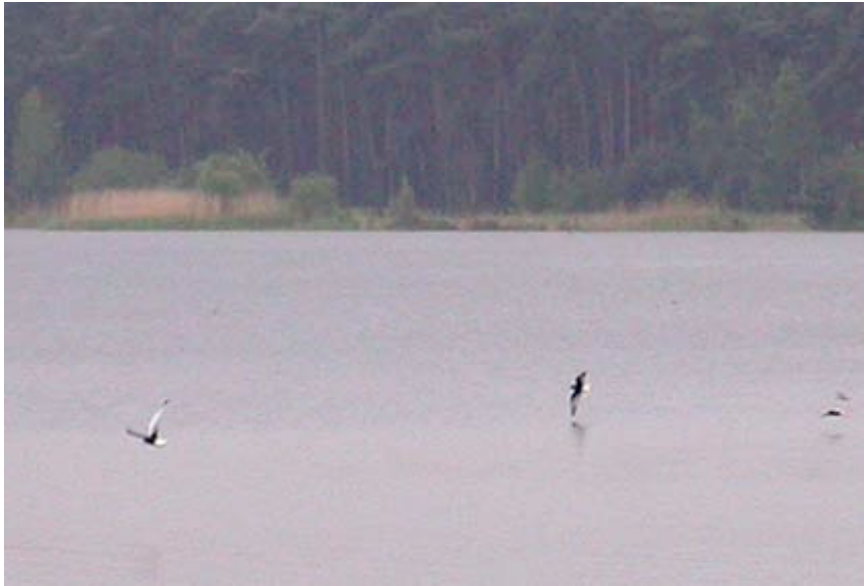
Witvleugelsterns, Put Rauw, 20 mei (Lex Peeters)

Half mei was er in Nederland en België sprake van een ongekennde invasie van Witvleugelsterns (honderden ex.), met daartussen ook regelmatig Witwangen. De vogelaars in de streek deden hun uiterste best om daar wat van mee te pikken, maar de vruchteloze zoektochten leidden bijna tot wanhoop. Op 20-05 was het bij de put van Rauw dan toch raak. Lex Peeters trof er aanvankelijk 2 ex. aan, maar die kregen al snel gezelschap van nog 8, 3, 1, 1 en 1 ex, zodat er uiteindelijk maar liefst 16 rondvlogen. Nieuwe exemplaren werden door de anderen steeds onthaald door in compacte groep hoog op te vliegen (alsof ze vertrokken) en vervolgens gezamenlijk weer in te vallen, een gedrag dat ook elders tijdens deze invasie werd opgemerkt. Eli Van Audenhove was er getuige van dat twee ex. op een boei zelfs even tot copulatie overgingen.