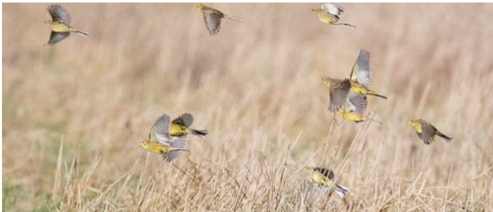
Geelgorzen, Riebosserheide (Monique Bogaerts)

Op 25-10 verbleef een groepje van 12 ex. bij 't Goorke in Arendonk.