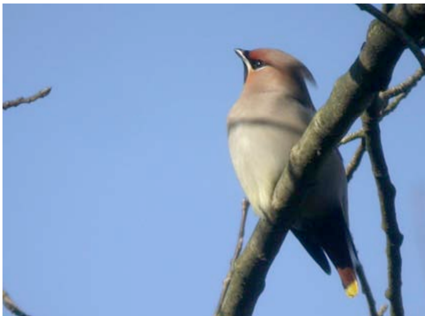
Pestvogel, Schansput/Grote Zandput, 2 maart (Lex Peeters)

Op 04-11 vloog een roepende Pestvogel in westelijke richting over de Ronde Put.