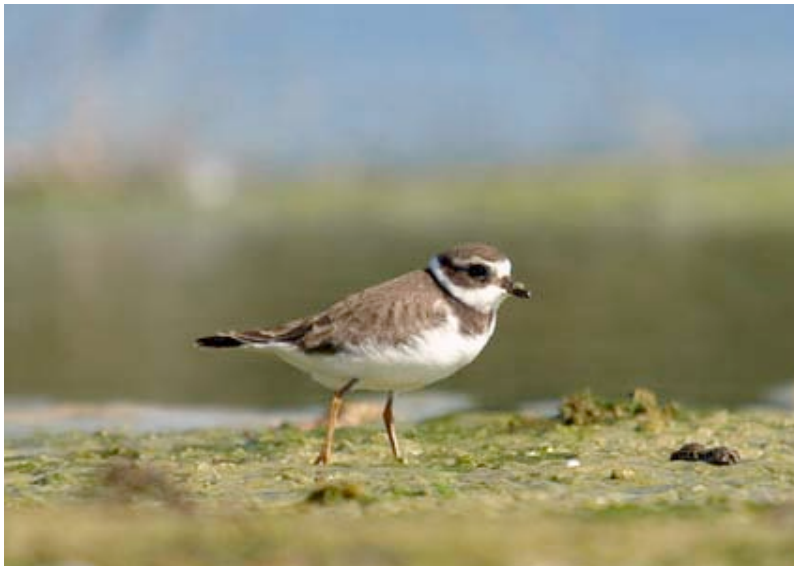
Bontbekplevier, Kristallijn, 22 september (Lex Peeters)

Een Bontbekplevier vloog op 15-02 roepend rond bij put Vercammen. Winterwaarnemingen zijn in het binnenland extreem.