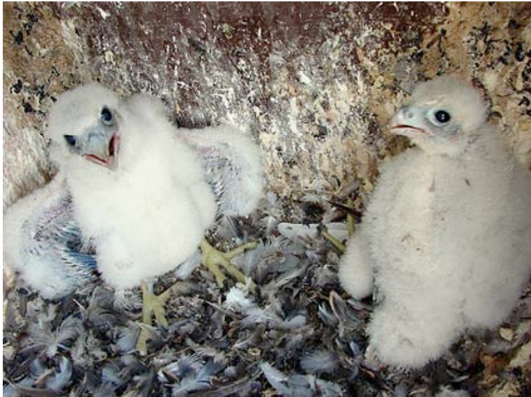
Slechtvalkpulli, Mol-Donk, 25 april

Het Slechtvalkenkoppel van de Electrabel-centrale in Mol-Donk manifesteerde zich vanaf half februari steeds nadrukkelijker en werd op 24-02 baltzend waargenomen. Het paartje bracht dit jaar 4 jongen (3 man, 1 vr.) groot. Op 25-04 kregen ze een kleurring rond hun poot. Om de kroost te kunnen voeden werd de zandplaat bij de Grote Zandput, getuige regelmatige waarnemingen daar, een steeds belangrijkere jachtplaats. Dat het echte standvogels zijn maken de waarnemingen van een jagend ex. op 11-11 bij Sas 6 Mol-Donk en een rustend ex. op 23-12 op de schouw duidelijk.