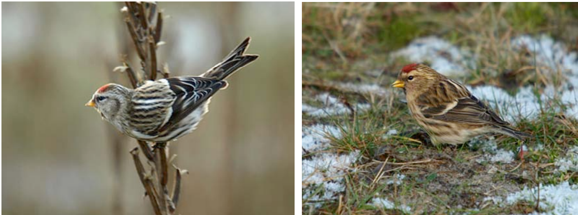
Grote Barmsijs (links) en Kleine Barmsijs, Stortplas, 19 december (Lex Peeters)

In winter 2006/2007 deelden Barmsijzen in de algehele 'vinkenmalaise'. Slechts enkele losse ex. werden opgemerkt.