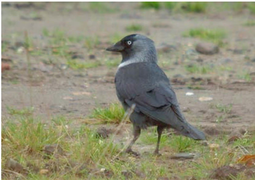
Noordse Kauw, Maatheide West, 6 november (Lex Peeters)

Half oktober was er sprake van ongewoon sterke Kauwen-trek. Op 14-10 trokken 1085 ex. over Maatheide, op 20-10 772 ex. Het totaal op de telpost kwam op 2983 uit, waarvan 2771 in oktober. Dat bracht de soort verrassend op de tiende plek in de lijst van talrijkste trekkers over Kristallijn/Maatheide.