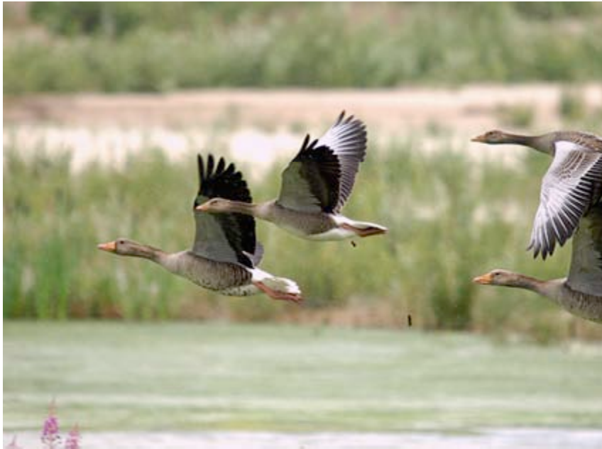
Grauwe Ganzen, Kristallijn, 23 juni (Lex Peeters)

De Grauwe Gans is in de natte regio uitgegroeid tot een dominant aanwezige jaarvogel. Op veel locaties kwam de soort weer tot broeden, maar lang niet alle broedgevallen werden gemeld. De gegevens die ons ter beschikking staan: op 13-04 1 paar met pulli op 't Kristallijn; op 05-05 1 paar met pulli op de Wateringen en 14 paren met pulli (+ 30 ad.) op de Ronde Put; op 17-05 5 paren met pulli op de put van Rauw. Tot ver in het broedseizoen en alweer in de prille zomer werden grote groepen aangetroffen, zoals 117 ex. op 17-04 en 113 ex. op 24-06 bij de Ronde Put en 120 ex. op 19-07 bij 't Goorke. Er wordt in de regio blijkbaar ook op vrij grote schaal door Grauwe Ganzen overzomerd.