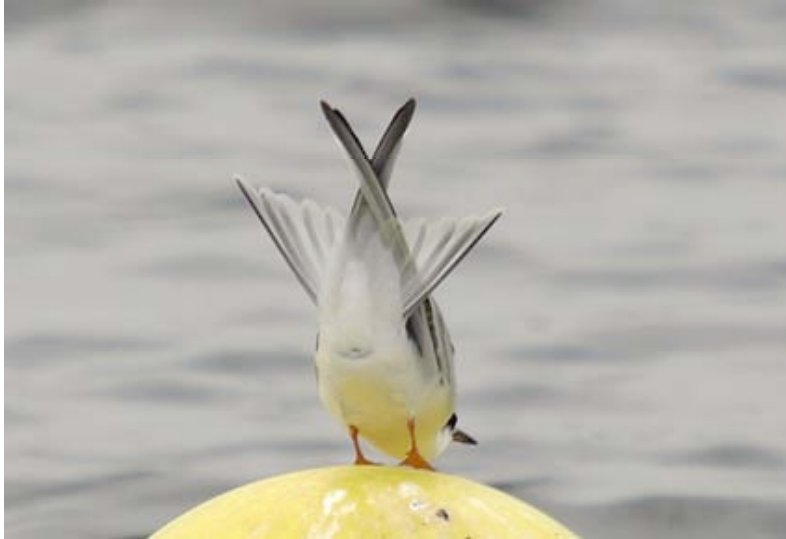
Visdief, Kanaalplas, 20 augustus (Lex Peeters)