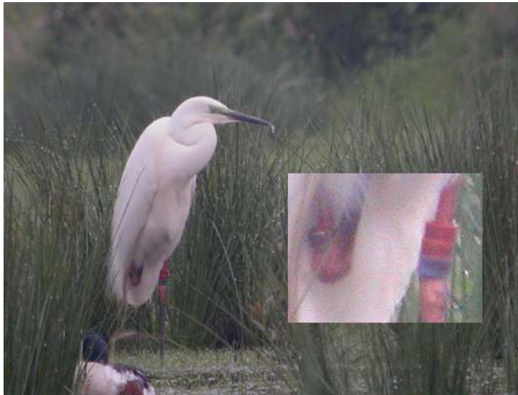
Gekleurde Grote Zilverreiger, Grote Kievit, 16 mei

Hieruit valt af te leiden dat de Grote Zilverreigers in de loop van december, welke maand gepaard ging met twee pittige vorstperiodes waarin ondiepere waters dichtvroren, naar stromend water uitweken: hoewel er aan de open plassen steeds minder werden geteld bleek hun aantal op de slaapplekken immers alleen maar te zijn toegenomen.