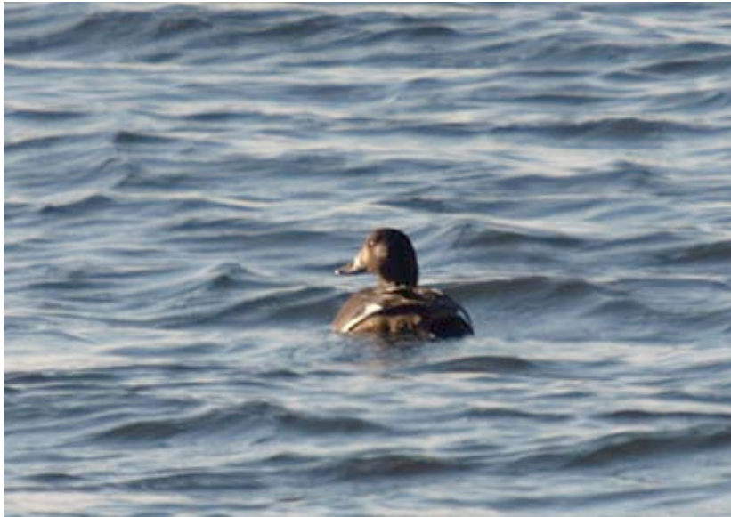
Grote Zeeeend, Put Rauw, 16 december

Een wijfje Grote Zeeeend verbleef van 30-12-2006 tot 07-01 op de grote plas bij Rauw. De vogel liet zich regelmatig fraai en op redelijke afstand observeren.