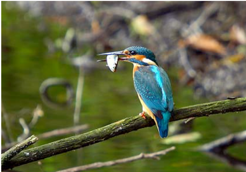
IJsvogel, Grote Kievit, september

IJsvogels lijken het in de streek bijzonder goed te doen. Verbetering van de waterkwaliteit, betere bescherming en zachte winters zullen daaraan hebben bijgedragen. Op diverse locaties werden bezette nestholten aangetroffen en op andere plekken wees weer de aanwezigheid van zingende, alarmerende of alerte oudervogels en/of uitgevlogen jongen op een broedgeval. Al turvend en extrapolierend lijkt de conclusie gerechtvaardigd dat het aantal territoria in de regio de dertig ruim zal overschrijden. Het