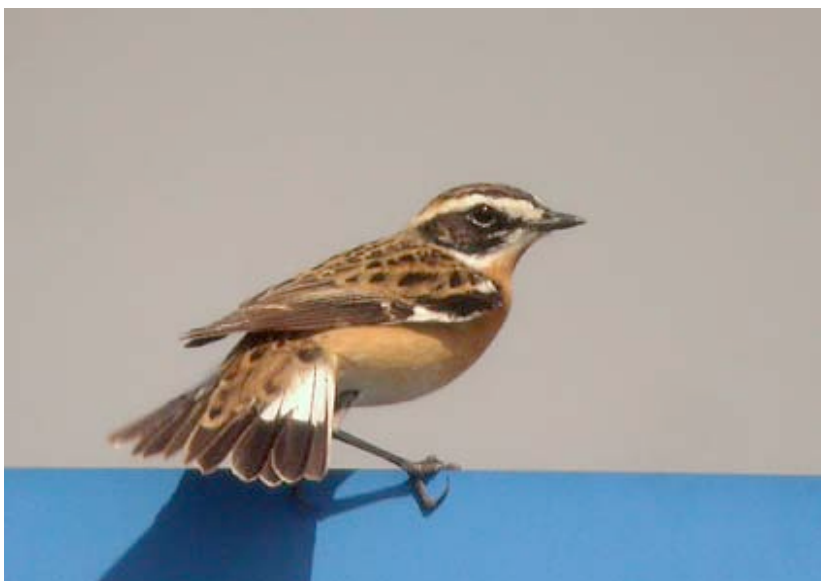
Mannetje Paapje, Maatheide, 13 april

Paapjes waren in 2007 zowel in voor- als najaar schaars. Op 13 en 14-04 zat 1 ex. op Maatheide, op 28-04 1 aan 't Kristallijn en 2 aan de Grote Zandput en op 02-05 en 04-05 resp. 2 en 3 op Maatheide. Op 05-05 werden de laatste 2 gezien bij de weilanden tegenover Kattestaart in Retie.