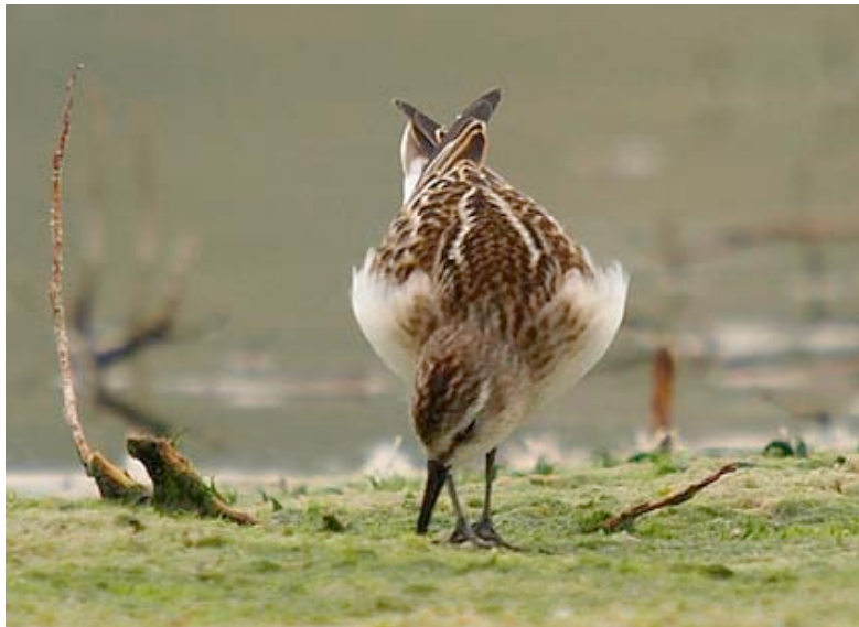
Kleine Strandloper, Kristallijn, 3 oktober

Mede dankzij de sterke strandloper trek medio mei kwamen we in 2007 tot een unieke reeks van zestien Kleine Strandloper-waarnemingen, voornamelijk van de Grote Zandput en meestal in klein aantal. Omdat dit geen jaarlijks fenomeen is worden ze hieronder allen vermeld: