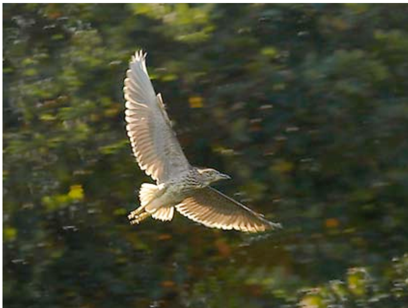
Juvenile Kwak, Scheps, 6 oktober (Lex Peeters)

Van 05-09 tot en met tenminste 06-10 verbleef een onv. Kwak op een vaste roestplek aan een van de voormalige viskweekvijvertjes in Scheps. Tijdens de tellingen van Grote Zilverreigers op de slaapplek ten oosten van put Stroobants werd op 24-11 en 09-12 een Kwak waargenomen, die van hieruit in de avondschemer naar z'n voedselstek vertrok. In beide gevallen was het al te donker om vast te kunnen stellen of het een volwassen vogel betrof.