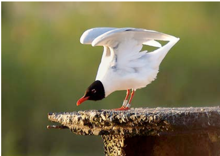
Minimaal 13 jaar oude, gekleurringde Zwartkopmeeuw, Glasfabriek

De aanwezigheid van Zwartkopmeeuwen in de Kokmeeuwkolonie bij Glasfabriek leidde in de periode maart tot en met juni in de regio tot veel losse waarnemingen van de soort, zodat we die in dit overzicht buiten beschouwing laten. Over Kristallijn/Maatheide werden 77 overtrekkende ex. waargenomen. Het zwaartepunt lag met 60 ex. nadrukkelijk in april, met op 15-04 in korte tijd maar liefst 31 adulte ex. die Kristallijn van west naar oost passeerden. Deze opvallende instroom van Zwartkopmeeuwen werd die dag op meerdere binnenlandse telposten vastgesteld. Op 23-04 telde Lex Peeters 's avonds in de kolonie van Glasfabriek maar liefst 87 Zwartkopmeeuwen, met naast de circa 30 broedvogels dus veel passanten die er kwamen slapen.