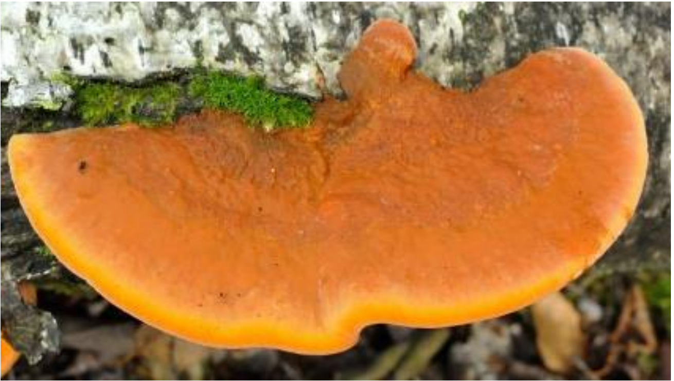
De vermiljoen houtzwam