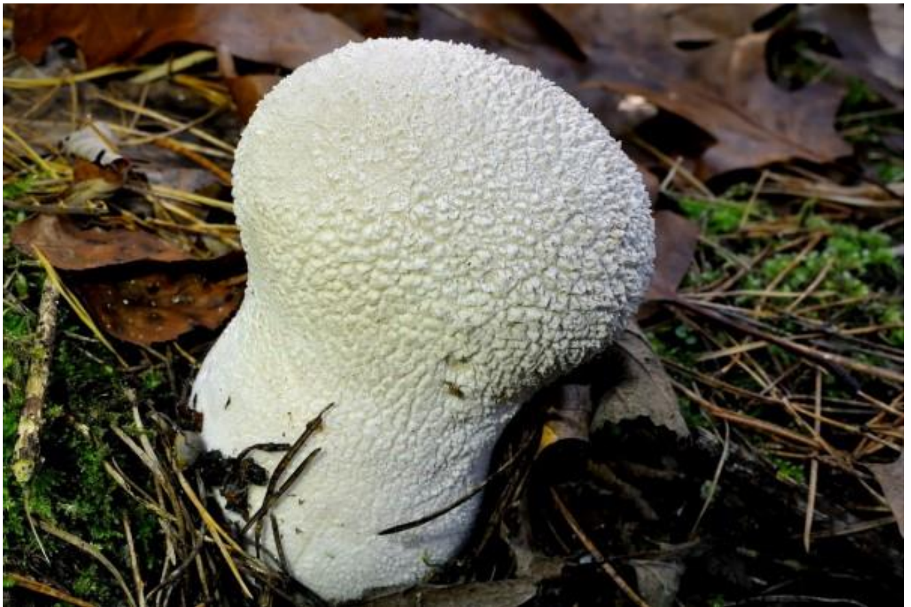
Ruitjesbovist op plooiervoetstufzwam wie zal het nu zeggen?