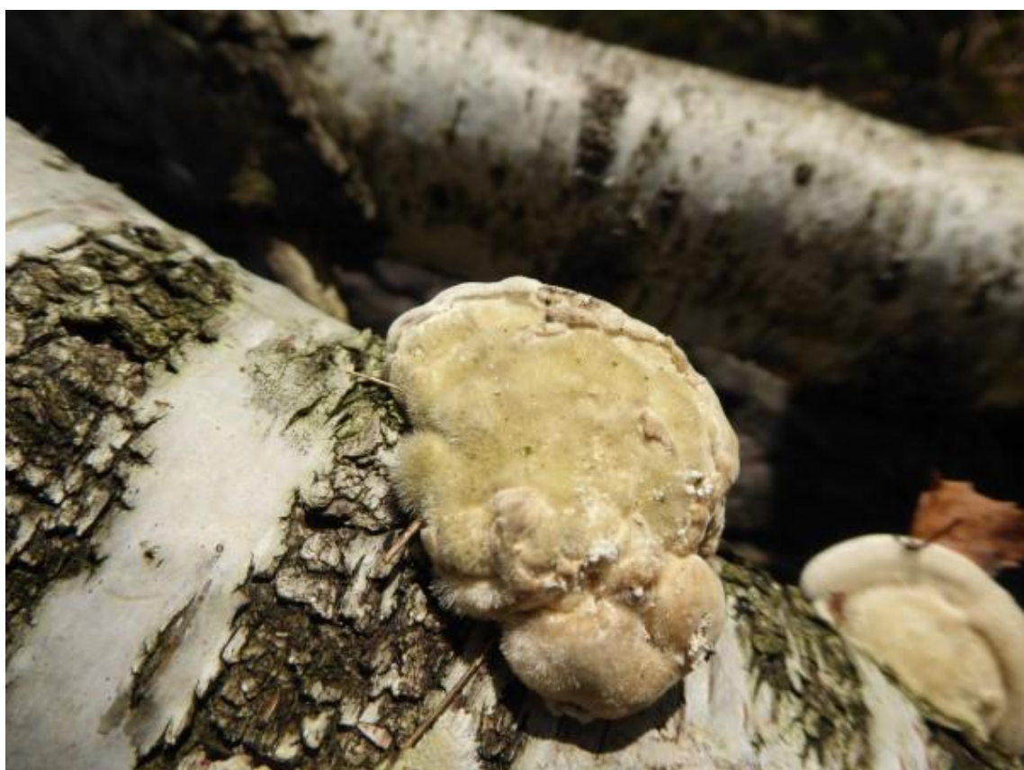
Het ruig elfenbankje