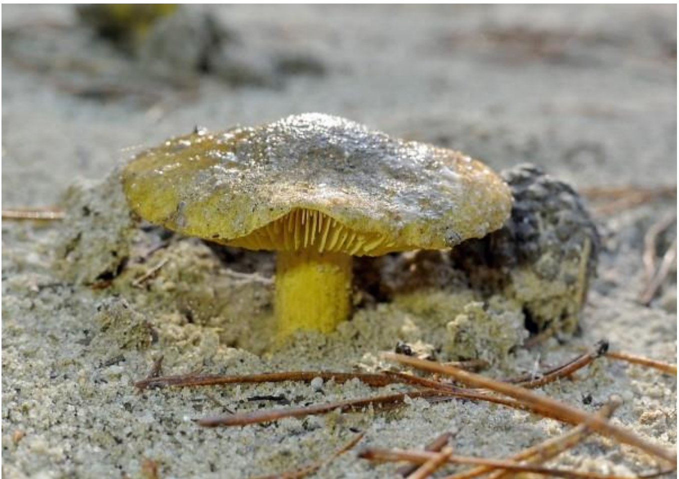
Als je naar de sahara gaat mag je deze natuurlijk niet missen de gele ridderzwam