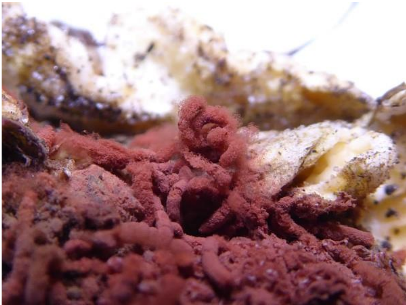
Het karmijnrood netwatje