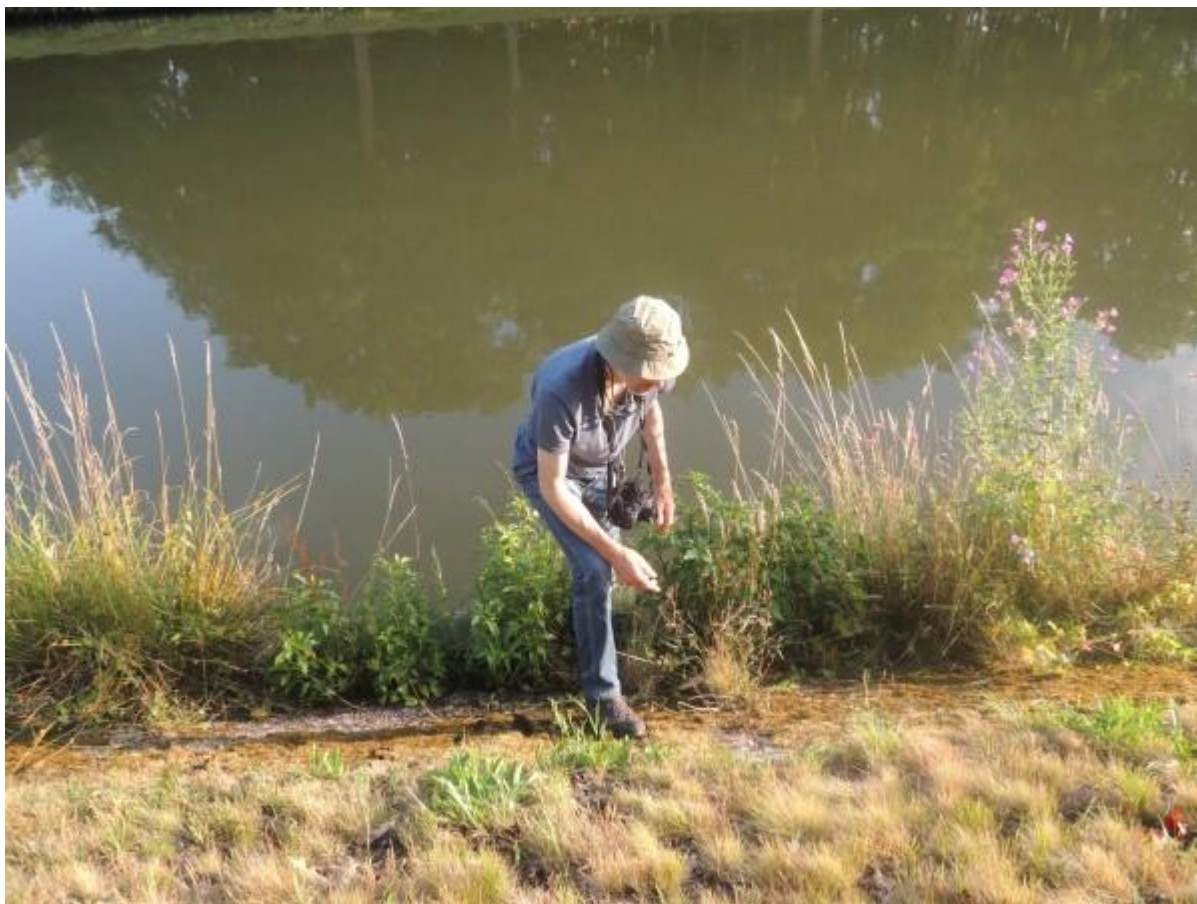
Sommigen wilden zo dicht mogelijk bij het water zijn