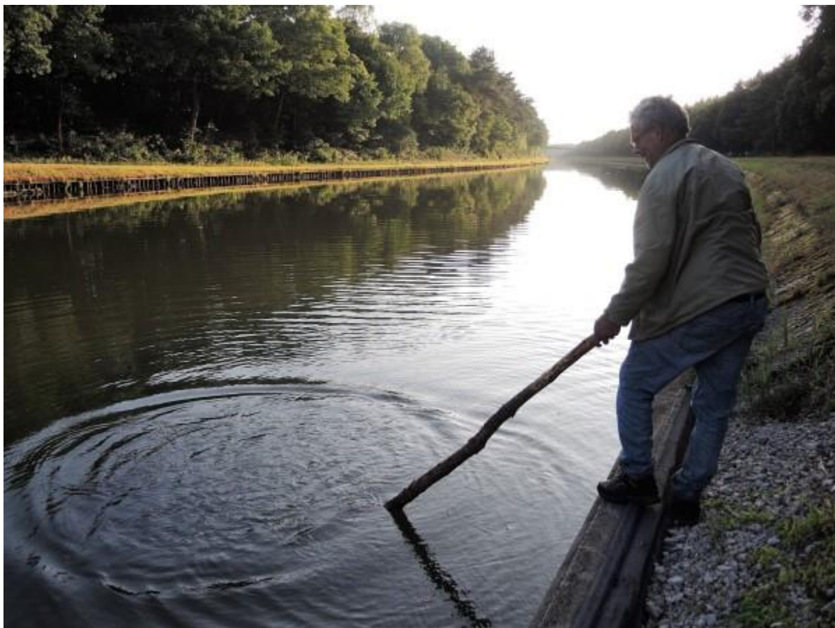
Vistechnieken werden uitgetest om bij de plantjes te komen