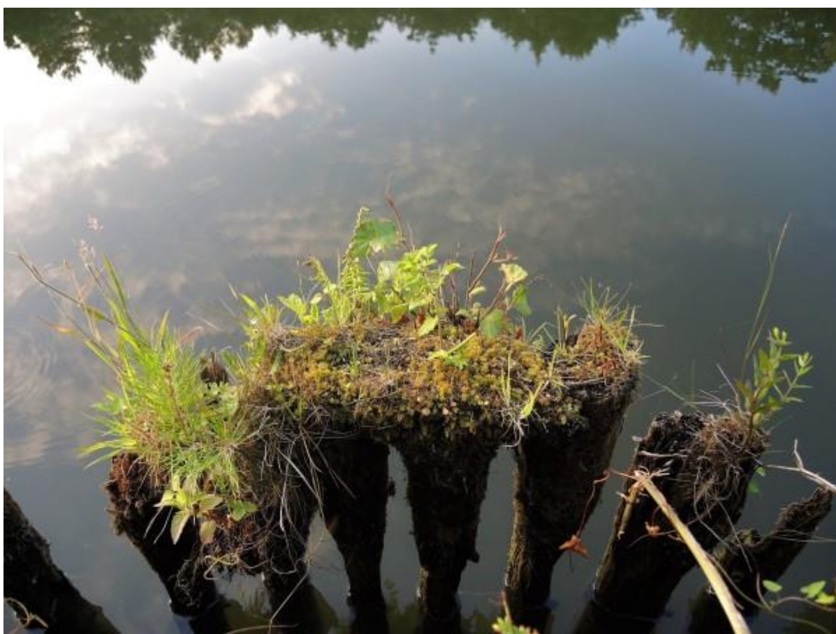
Want die zoeken de meest gekke plaatsen op om te groeien