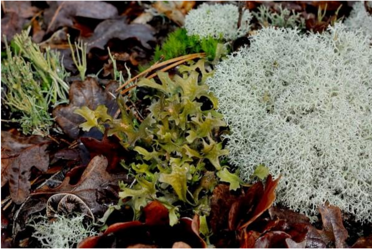
Ijslands mos, openrendiermos en girafje wie is wie?