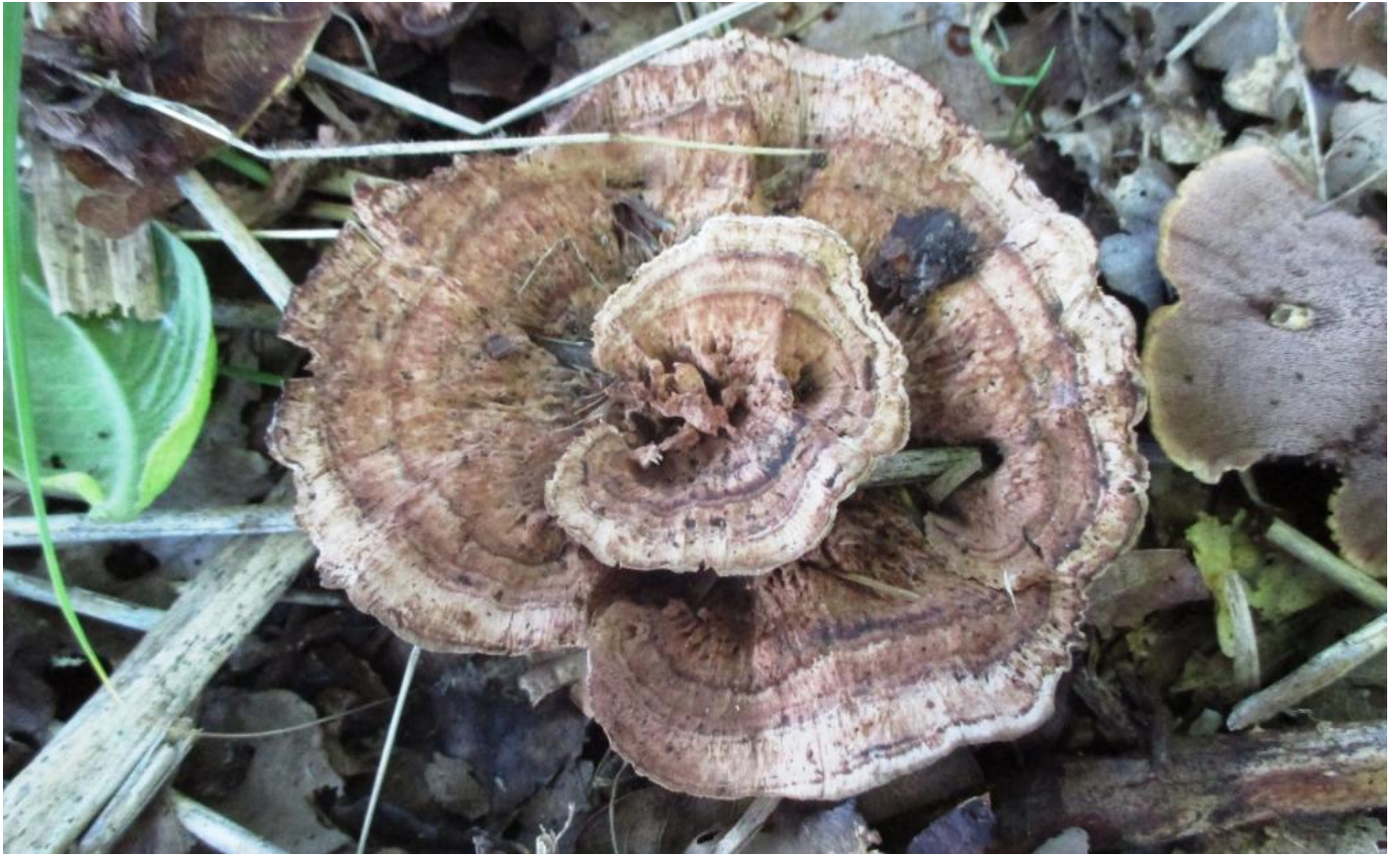
De gezoneerde stekelzwam